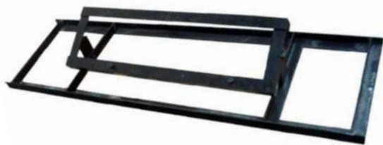
Suporte para apoio de Cabeçotes linha leve